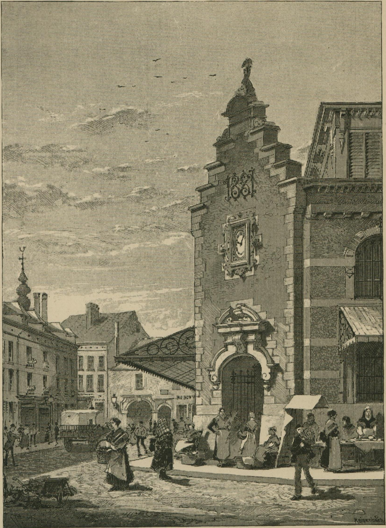
LE NOUVEAU MARCHÉ DE SAINT-GÉRY.